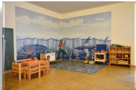
Spielecke für Kinder