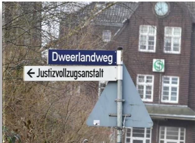
Hinweisschilder zur JVA am S-Bahnhof Billwerder-Moorfleet

Sie erreichen uns am besten mit dem PKW . Ausreichend Parkplätze stehen Ihnen direkt am Anstaltsgelände zur Verfügung. Alternativ erreichen Sie uns mit der S21 Haltestelle Billwerder-Moorfleet . Von dort folgen Sie der Beschilderung ca. 1500m zur JVA Billwerder.