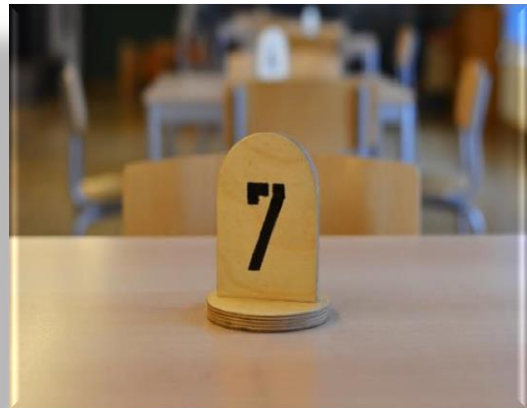
... Ihrer Tischnummer im Besucherraum.

Die vorgegebene Sitzordnung ist einzuhalten. Bitte achten Sie darauf, dass Ihre Kinder entweder am Tisch oder in der dafür vorgesehenen Spielecke bleiben.