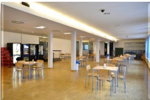
Besucherraum mit Snack- und Getränkeautomaten

Die JVA Billwerder verfügt über ein eigenes Besuchszentrum. Der Zugang ist barrierefrei eingerichtet.