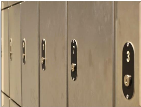
Die Schließfachnummer entspricht ...

Es ist untersagt, Gegenstände, Geld (außer das zugelassene Münzgeld) oder Alkohol/ Drogen in die Anstalt einzubringen und beim Besuch an den Gefangenen zu übergeben. Sie dürfen keine Gegenstände, z.B. Briefe der Insassen, vom Besuch mit aus der Anstalt nehmen.