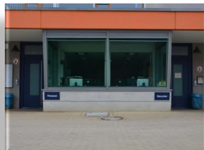
Besuchereingang auf der rechten Seite

Den genauen Besuchstermin Ihres Besuches erfahren Sie bei der Terminabsprache.